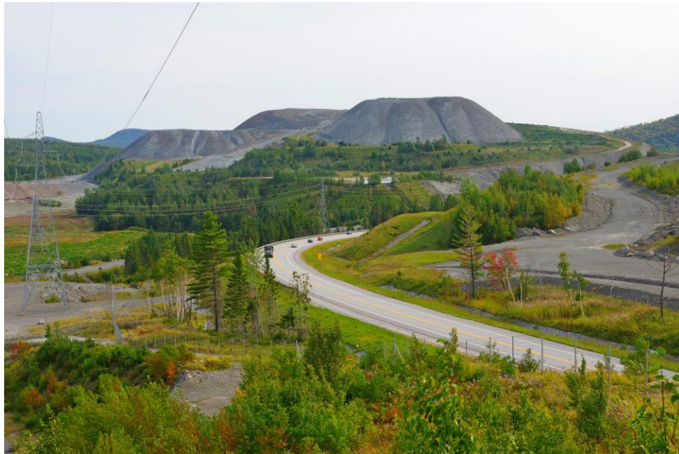
Photo 7 Certains pentes, notamment à proximité de la route 112 ont déjà été revégétalisés. Cependant, la majorité des talus demeure instable et vulnérable à l'érosion excessive.

Même si certaines surfaces instables ont déjà été revégétalisées, notamment à proximité du corridor de la route 112, la majorité des talus des haldes demeurent exposés au ruissellement et à l'érosion (photo 7). Étant donné la grande étendue de ces surfaces ainsi vulnérables, il n'est pas réaliste d'espérer une amélioration à court ou à moyen terme (voir le plan 3 en annexe).