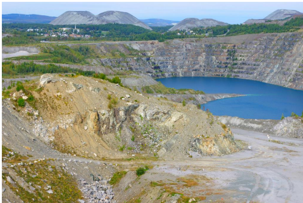
Photo 1 Vue sur la mine du lac de l'Amiante à partir du sud-ouest.

Les coordonnées géographiques du centre de la zone étudiée sont N 46° 02' 25" et O 71° 22' 07". La section analysée est relativement facilement accessible par des chemins publics et par des chemins gravelés. La photo 1 montre la configuration actuelle du terrain à l'endroit où se situait le lac Noir.