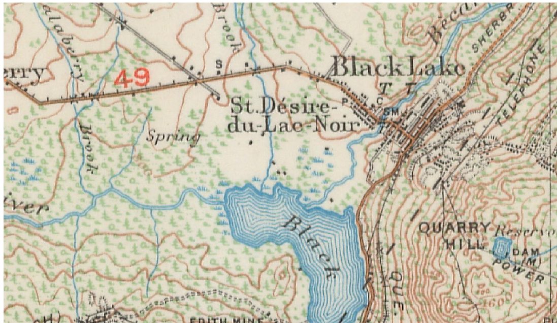
Figure 1 Carte topographique montrant le réseau hydrographique naturel du lac Noir.