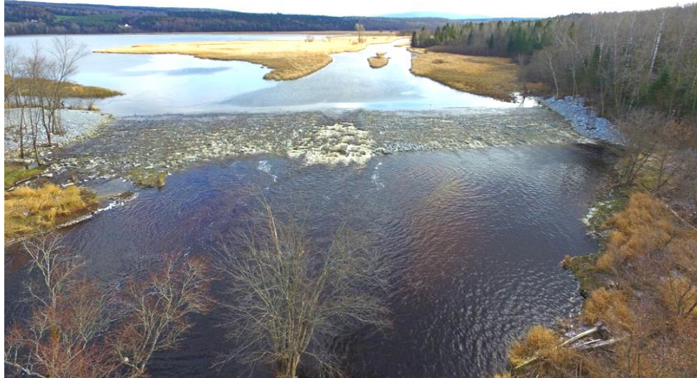
Photo 2 L'étang Stater a été créé pour favoriser la décantation des sédiments. Cependant, sa capacité est déjà pratiquement atteinte et le surplus de sédiments affecte les plans d'eau situés en aval.