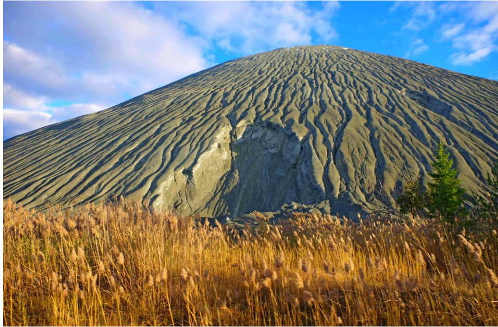
Photo 4 Les pentes des haldes sont soumises à des processus érosifs considérables, ce qui entraîne la formation de ravins. De plus, l'instabilité des pentes se manifeste par des ruptures multiples de la nature géotechnique.