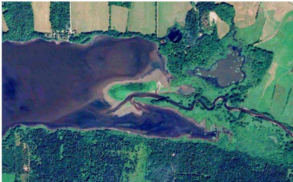
Photo 3 La section amont du lac à la Truite est progressivement envahi par le matériel granulaire provenant de la partie supérieure du bassin versant. Image satellitaire provenant de GoogleEarth.