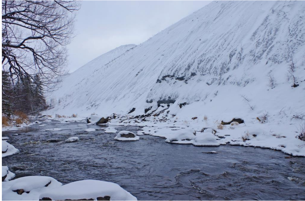
Photo 6 À quelques endroits, les haldes empiètent directement dans le cours d'eau. Les forces hydrodynamiques de la rivière sont responsables de l'érosion importante des talus.