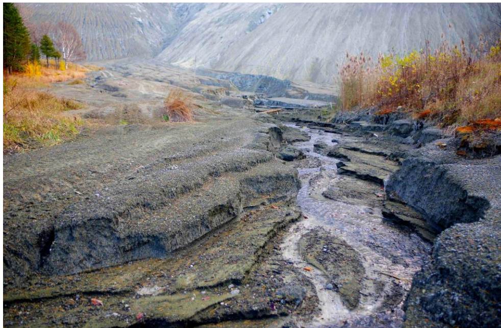
Photo 5 Les sédiments générés sur les pentes sont transportés vers le réseau hydrographique. En général, aucune zone de décantation n'est présente entre les haldes et la rivière.